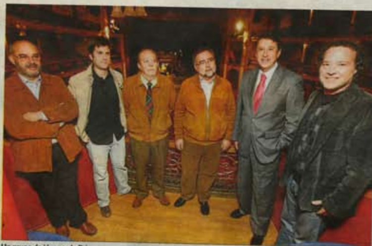
Un grupo de jóvenes la Primavera.