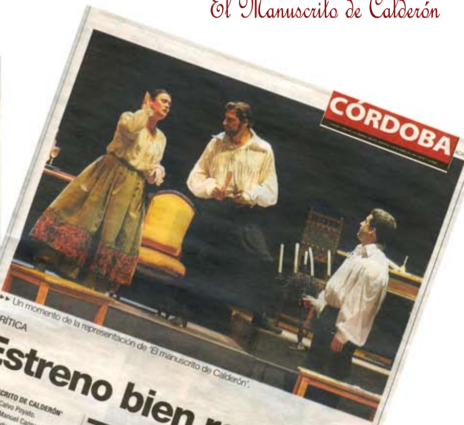
Un momento de la representación de «El manuscrito de Calderón».

El texto evoca un momento muy querido para los amantes del teatro: el Siglo de Oro. Pone en escena nada más que a Calderón de la Barca como uno de los personajes. Alude a las rencillas entre los autores, al ambiente en los corrales, el trabajo de los escenógrafos, etc. La adaptación de la novela permite imaginar cómo serían unos tiempos en que el estreno de una obra de teatro era capaz de paralizar a una sociedad. Hoy la sociedad sólo se paraliza con el fútbol. Hemos salido perdiendo.