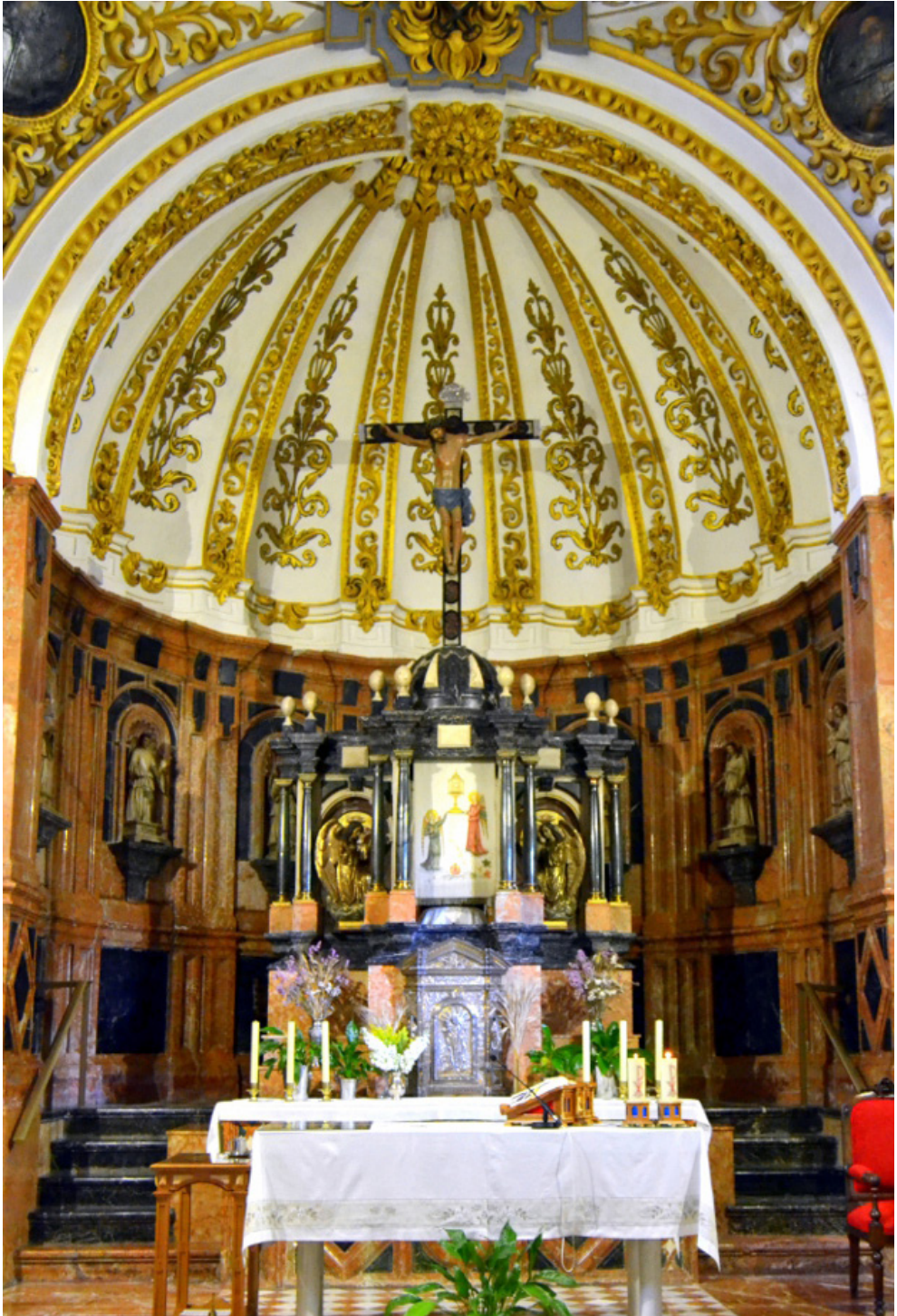
Figura 8. Melchor de Aguirre y taller, Capilla Mayor del Hospital del Corpus Christi , Granada, h. 1695.